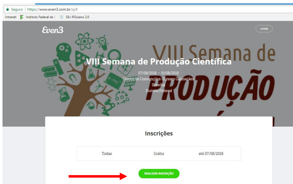
Figura 1. Tela inicial do sistema de submissão de resumos.

a) Acessar o endereço http://www.even3.com.br/sp8 (figura 1)