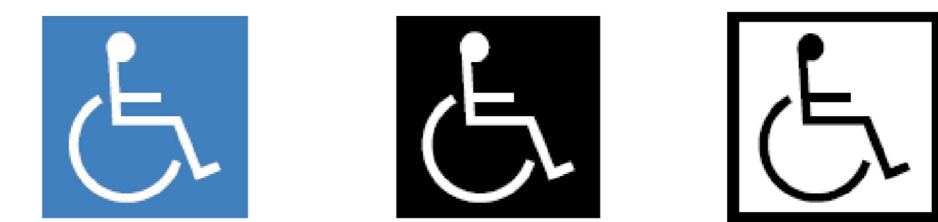
a) Branco sobre fundo azul b) Branco sobre fundo preto c) Preto sobre fundo branco

A indicação de acessibilidade nas edificações, no mobiliário, nos espaços e nos equipamentos urbanos deve ser feita por meio do símbolo internacional de acesso – SIA. A representação do símbolo internacional de acesso consiste em um pictograma branco sobre fundo azul (referência Munsell 10B5/10 ou Pantone 2925 C). Este símbolo pode, opcionalmente, ser representado em branco e preto (pictograma branco sobre fundo preto ou pictograma preto sobre fundo branco), e deve estar sempre voltado para o lado direito, conforme Figuras 31 e 32. Nenhuma modificação, estilização ou adição deve ser feita a estes símbolos. Este símbolo é destinado a sinalizar os locais acessíveis.