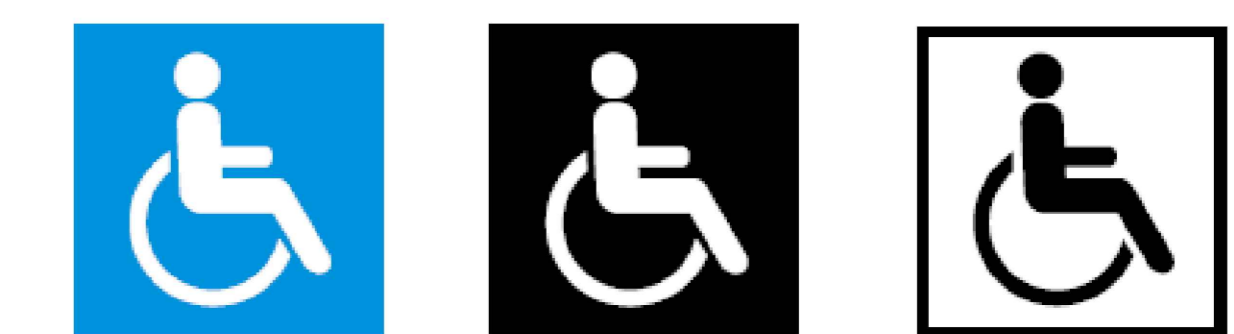
a) Branco sobre fundo azul b) Branco sobre fundo preto c) Preto sobre fundo branco