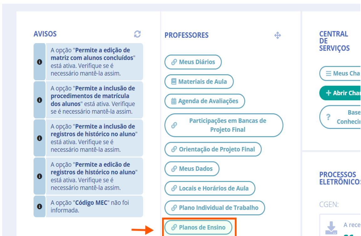
Figura 1 — Tela ilustrativa do SUAP (IFB).

Na tela inicial do SUAP, localize o quadro “Professores” e clique em “Planos de Ensino” .