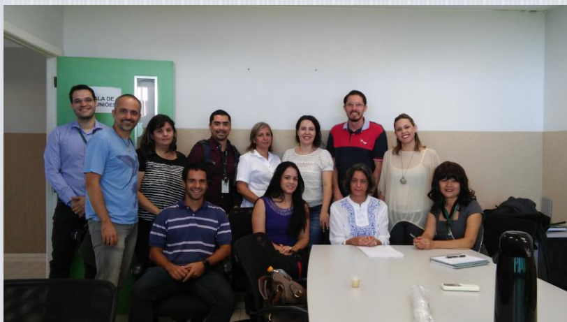
* Reunião da CDAS com IBRAM e Campus Samambaia 08.06.2016

Desde início de 2016 a Coordenação de Relações Institucionais e Articulação com a Sociedade (CDAS) trabalhou para regulamentar o fluxo de firmar parcerias (passo a passo), a fim de estabelecer parcerias mais efetivas para os estudantes e facilitar a execução da formalização das parcerias nos Campi .